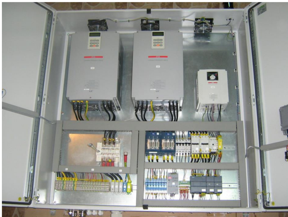
Zdjęcie 2. Widok wnętrza