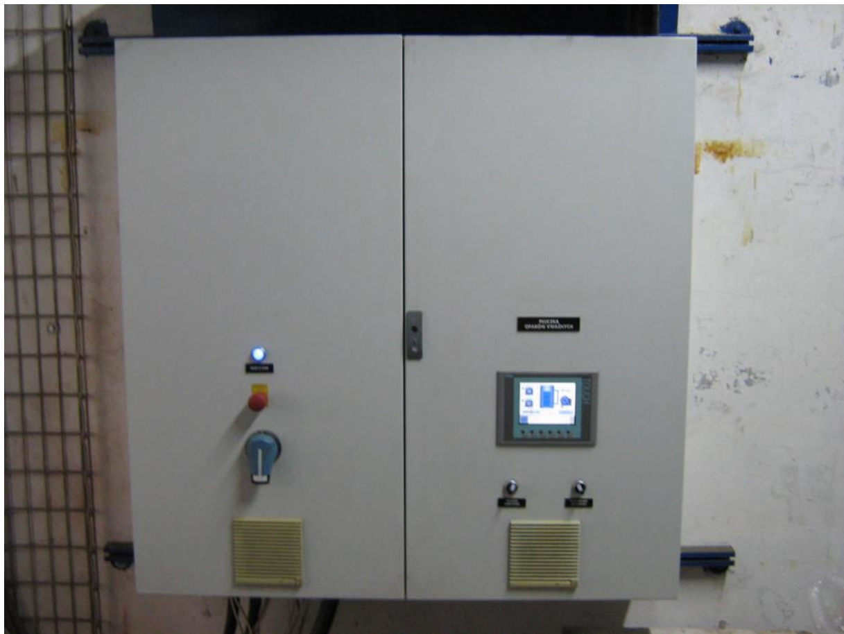
Zdjęcie 1. Widok zewnętrzny

System jest przeznaczony do sterowania instalacją oczyszczania powietrza w ocynkowni ogniowej. W trakcie procesu cynkowania metalu powstaje szereg szkodliwych związków. Zachodzi konieczność uzdatnienia zanieczyszczonego powietrza.